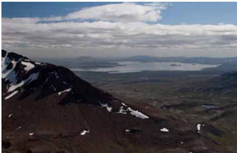
Séð til Þingvallavatns og þjóðgarðsins á Þingvöllum af Botnssúlum.

Þjóðgarðurinn Snæfellsjökull var stofnaður árið 2001 og er flatarmál hans um 170 km 2 . Þjóðgarðurinn er stofnaður á grundvelli náttúruverndarlaga og lýtur hann stjórn Umhverfisstofnunar. Um þjóðgarðinn hefur verið sett sérstök reglugerð, rg. nr. 568/2001, sbr. 928/2005. Ekki er þar sérstaklega fjallað um markmiðið með stofnun og starfsemi hans. Reglugerðin hefur m.a. að geyma reglur um réttindi og skyldur gesta og um starfsemi í þjóðgarðinum. Mannvirkjagerð, efnistaka og hvers konar annað jarðrask er háð leyfi Umhverfisstofnunar og sama er að segja um hvers konar atvinnustarfsemi og samkomuhald. Það er í verkahring Umhverfisstofnunar að gera tillögu að verndaráætlun og landnotkun fyrir þjóðgarðinn en ekki er kveðið nánar á um efni verndaráætlunar. Umhverfisráðherra staðfesti verndaráætlun fyrir þjóðgarðinn Snæfellsjökul 15. júní 2010. Tvö friðlönd, Búðahraun og ströndin við Arnarstapa og Hellna, heyra undir stjórn þjóðgarðsins, sem og eitt náttúruvætti, Bárðarlaug.