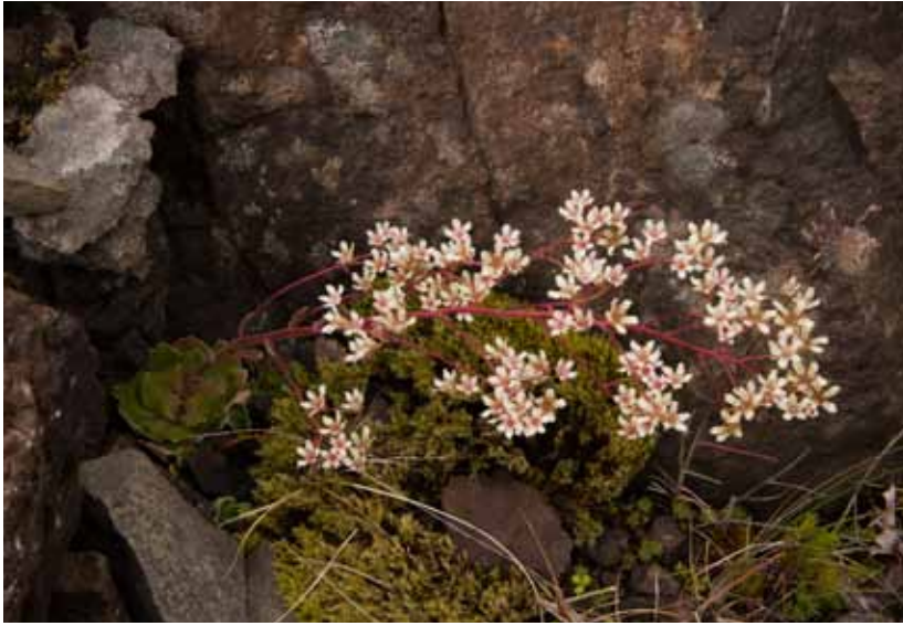
Klettafrú í Skaftafelli

nefnd forgangstegund. Ákvörðun um forgangstegundir er tekin með reglugerð og þar má m.a. kveða á um bann við því að veiða, skaða eða eyða lífverum af viðkomandi tegund 361 og setja reglur um vernd tiltekinna búsvæða (ökologiske funksjonsområder), sbr. 24. gr. Tengsl eru á milli ákvæða um vernd þessara búsvæða og ákvæða V. kafla um svæðavernd, einkum um svæði til verndar vistgerðum eða vistkerfum og stofnun friðlanda, enda er vernd tegundafjölbreytni eitt af markmiðum svæðaverndar, sbr. b-lið 1. mgr. 33. gr. Ákvæðin eru þó ólík að því leyti að V. kafli fjallar um vernd landfræðilega afmarkaðra svæða en búsvæðavernd samkvæmt 24. gr. er bundin þáttum sem varða lífshætti