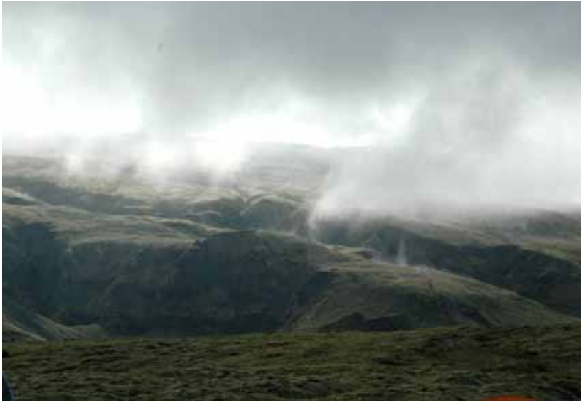
Óbyggð víðerni sunnan Vatnajökuls, í Djúpárdal, Fljótshverfi.

veðsetningu. Þingvellir voru samþykktir á heimsminjaskrá Menningarmálastofnunar Sameinuðu þjóðanna (UNESCO) árið 2004 vegna menningarminja. 345