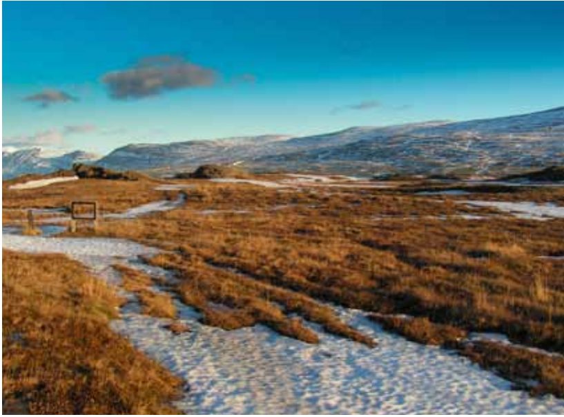
Krossanesborgir á Akureyri, fólkvangur.

að með stofnun þeirra væri stefnt að því að stemma að meira eða minna leyti stigu við umferð. Það má því segja að minni munur sé nú á þessum flokki og öðrum friðlýsingarflokkum þó í auglýsingum um stofnun friðlanda sé stundum kveðið á um tímabundnar takmarkanir á umferð.