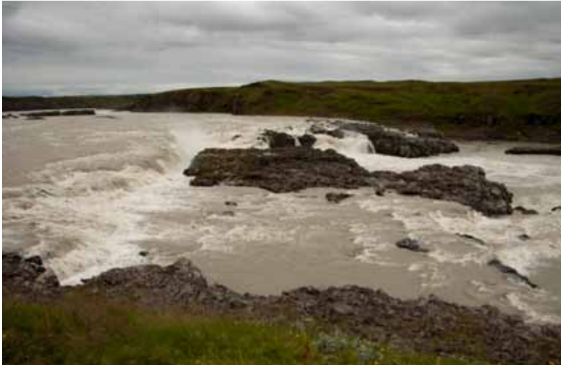
Urriðafoss í Þjórsá.

inu ber stjórnvöldum skylda til að grípa til verndaraðgerða í samræmi við ákvæði laganna. 380