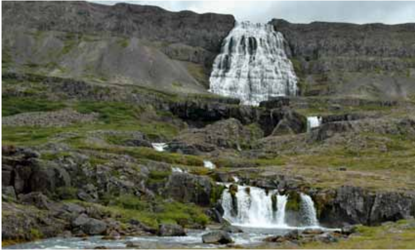
Dynjandi í Dynjandisvogi fyrir botni Amarfjarðar.

innan vatnsverndarsvæðisins. Óheimilt er að stunda fiskeldi í eða við Þingvallavatn og fiskrækt er háð leyfi umhverfisráðherra. Í lögnum er ekki gert ráð fyrir að gerð sé verndaráætlun fyrir svæðið.